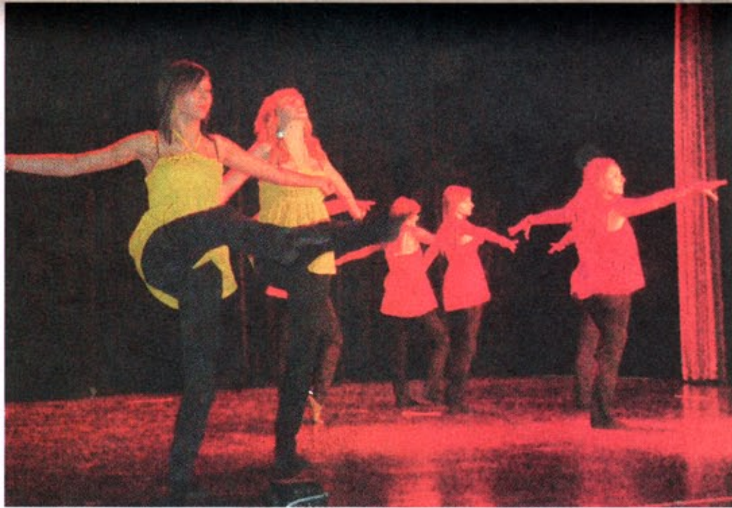
Die „Hip Teens“ eröffneten den Tanzabend