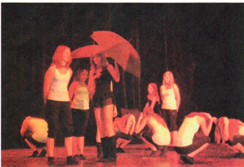
Originelle Choreographie mit Regenschirmen