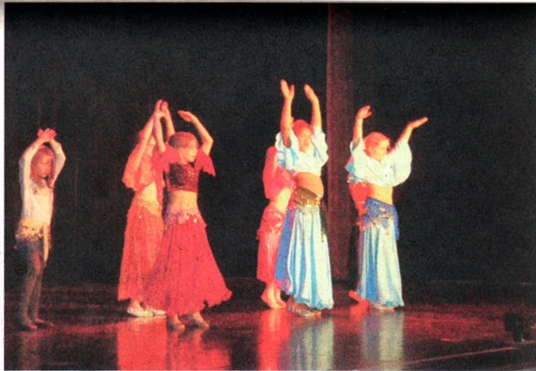
Die Kleinsten unter den Bauchtänzerinnen