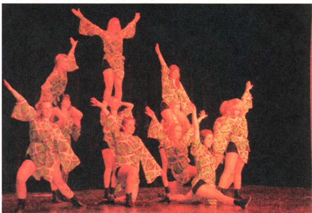
HAI-LIGHT - das Highlight des Abends