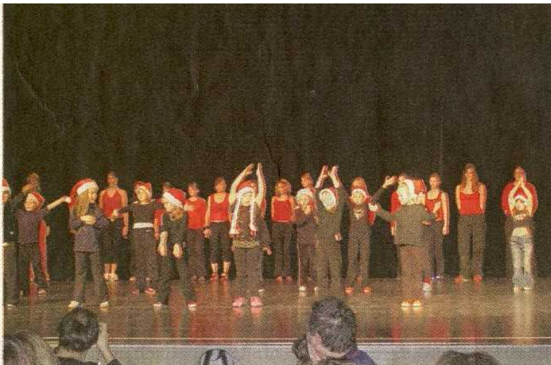
Die Kleinsten auf der Bühne