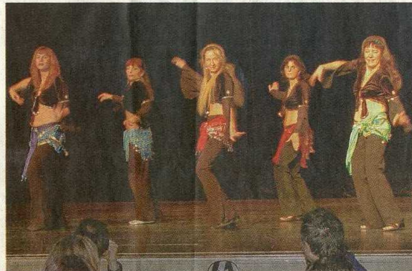
Bauchtänzerinnen waren ein Blickfang

Die Weihnachtsshow des TSC bot den vielen Besuchern einen Augen- und Ohrensmaus. Es war für die Gäste ein vergnüglicher Nachmittag voller Geselligkeit und Freude über das Tanztalent der Töchter und auch einiger Söhne. Die Moderation hatte in souveräner Weise der Vorstand Alois Labermeyer inne.