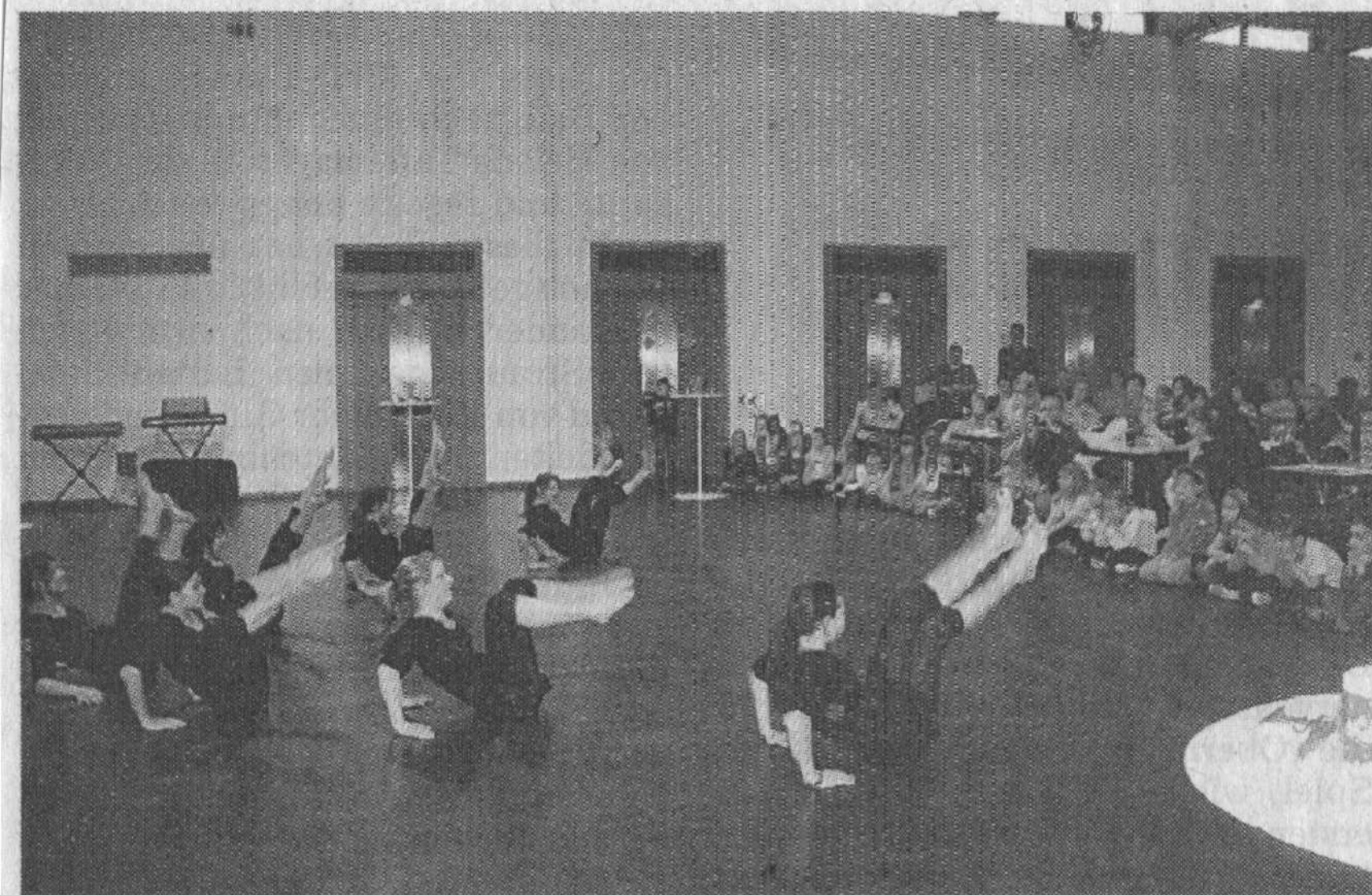
Mit Jazztanz konnte der TSC begeistern