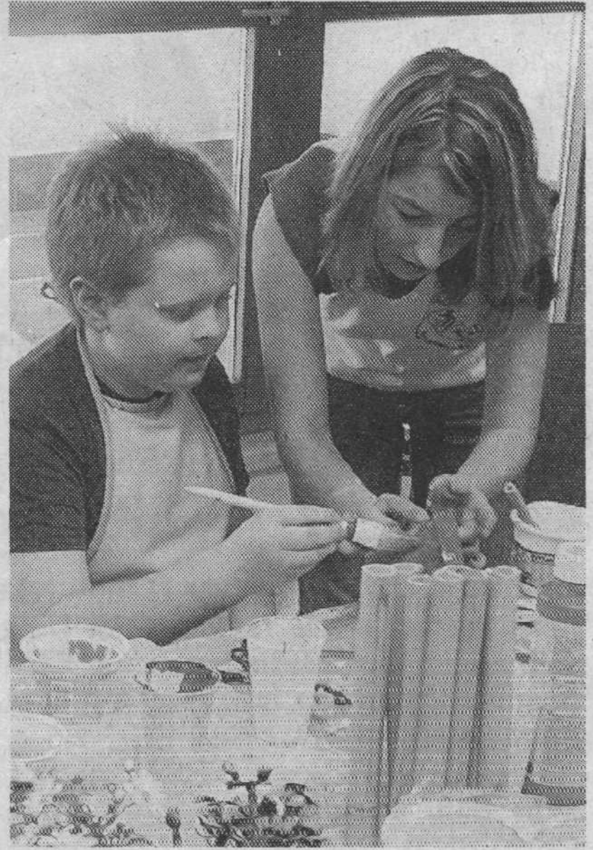
Die Kinder helfen sich gegenseitig

Dingolfing. Am vergangenen Samstag hatte der Jugendausschuss der Tanzsportclubs Rot-Weiß Casino alle Kinder (auch Nicht-Mitglieder) zum Bastelnachmittag ins Mehrzweckgebäude am Stadion eingeladen. Die Helfer hatten sich große Mühe gemacht, alles vorzubereiten. Auf dem Programm stand zuerst eine originelle Bambusvase. Dazu wurden Bambusstangen in verschiedene Längen gesägt und auf ein Holzbrett geklebt. Dabei konnten die jungen Gäste ihr handwerkliches Geschick beweisen. Beim anschließenden Blumentopf-Bemalen war Kreativität gefragt und so manches Kind entpuppte sich als kleiner Künstler. Die bemalten Kunstwerke wurden dann