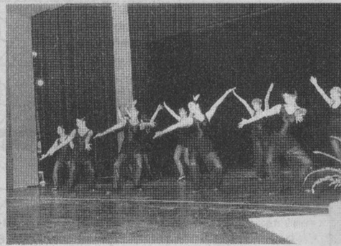
...es war fast unmöglich eine Nummer zu bevorzugen...