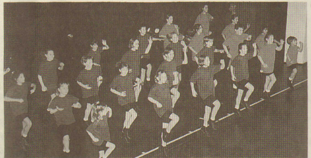
Brachten 1000 Zuschauer zum Mitklatschen: Die Rock'n'Roll-Kids des TSC.