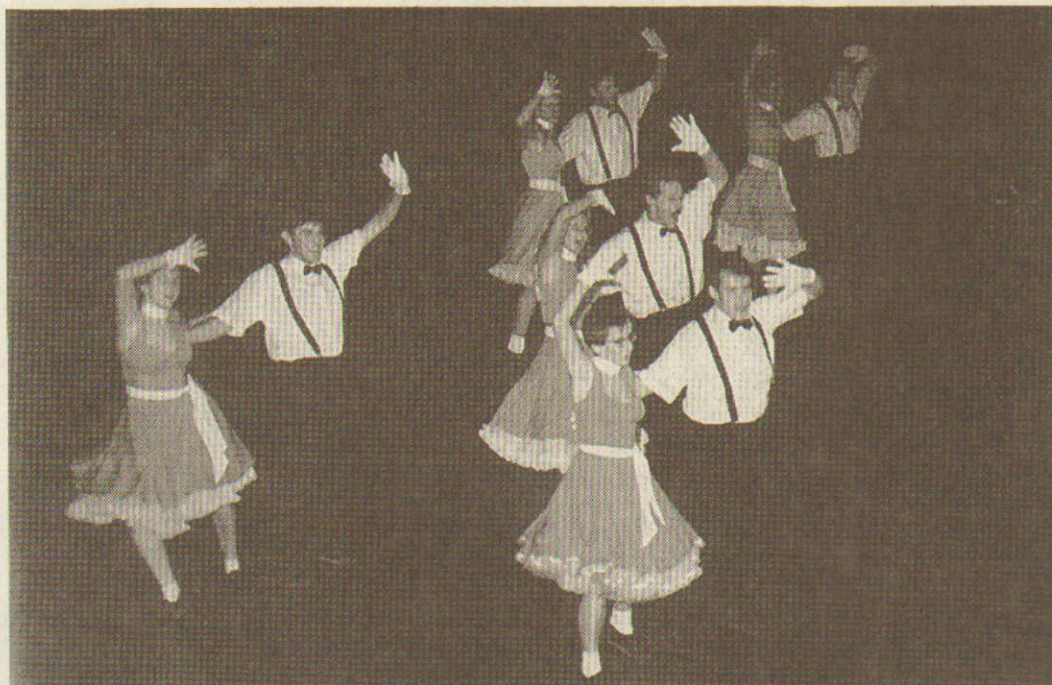
Zählen zu den Aushängeschildern beim Dingolfinger Tanzsportclub: Die Boogie Turtles. 1997 konnten sie sich bei den Europameisterschaften der Formationen auf den vierten Platz tanzen.