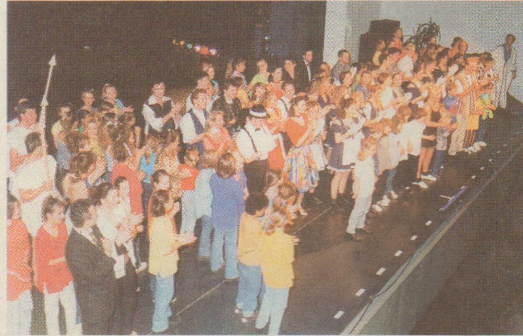
Die 135 Mitwirkenden boten eine tolle Bühnenshow vor 1000 Zuschauern.