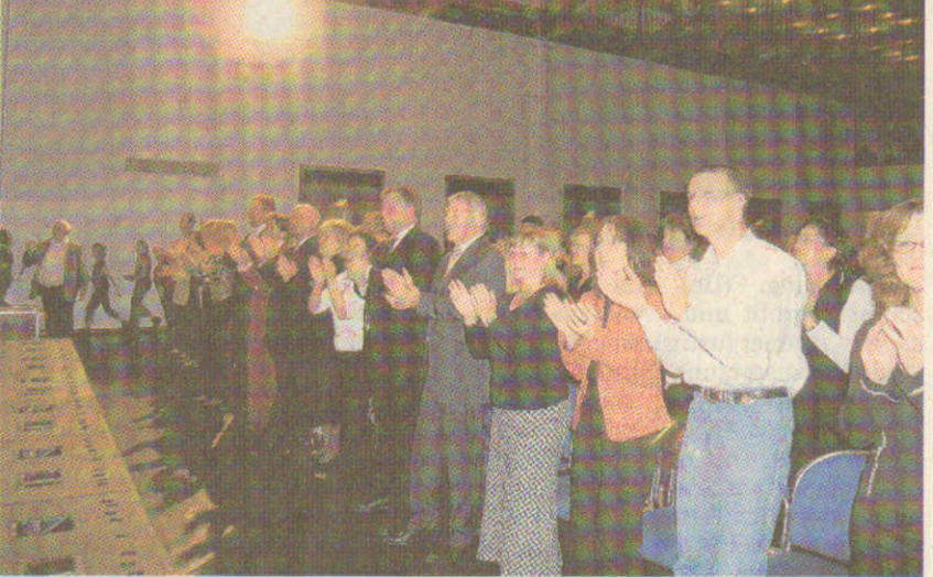
Standing Ovations zum Abschluss: das Publikum war begeistert