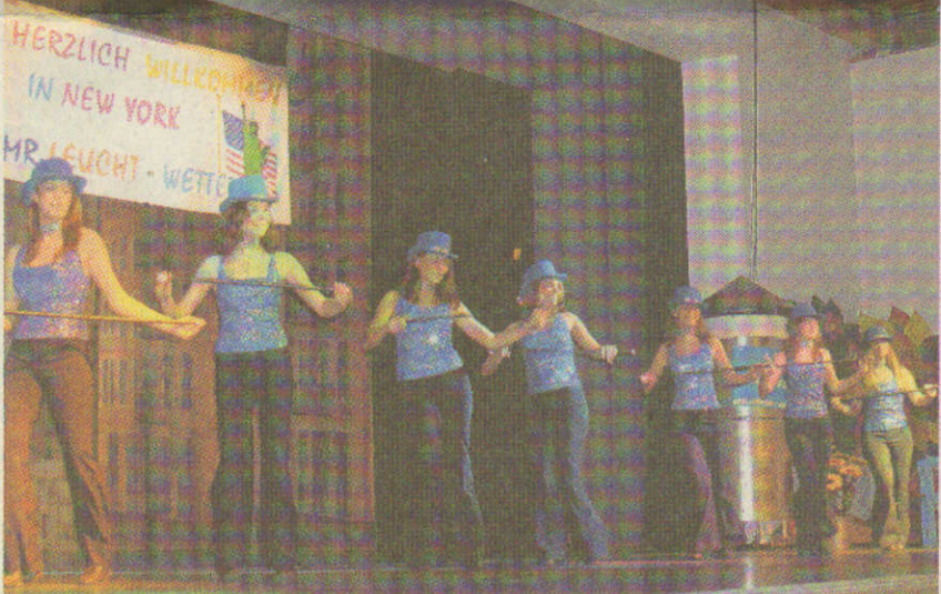
Begrüßten das Publikum: die Rocking Heartsbeats