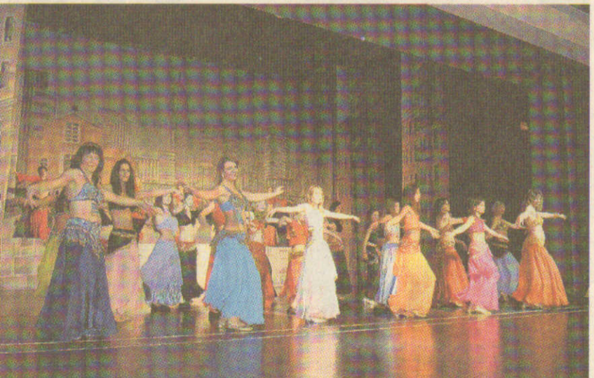
Die Bauchtänzerinnen zeigten eine „ägyptisch-spanische Hochzeit“