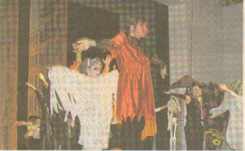
Gruseliges Halloween in „New York“