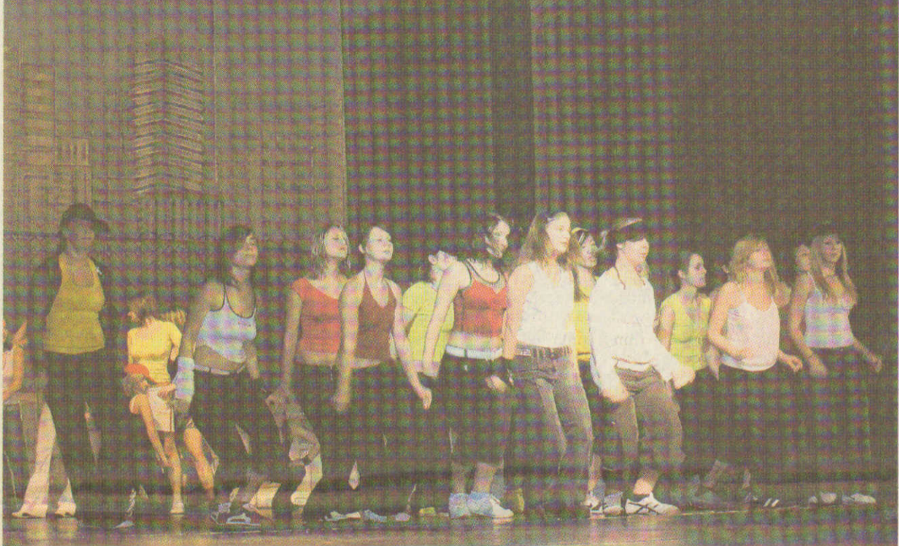
Die feschen Mädels zeigten dem Publikum was es auf sich hat mit dem „Hip Hop Club“

Mit einer gelungenen Tanzshow begeisterte der TSC am Wochenende in der Stadthalle