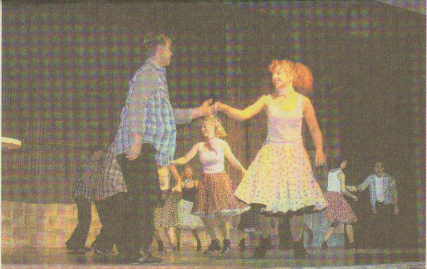
Waren mit dabei: die „Boogie Turtles“