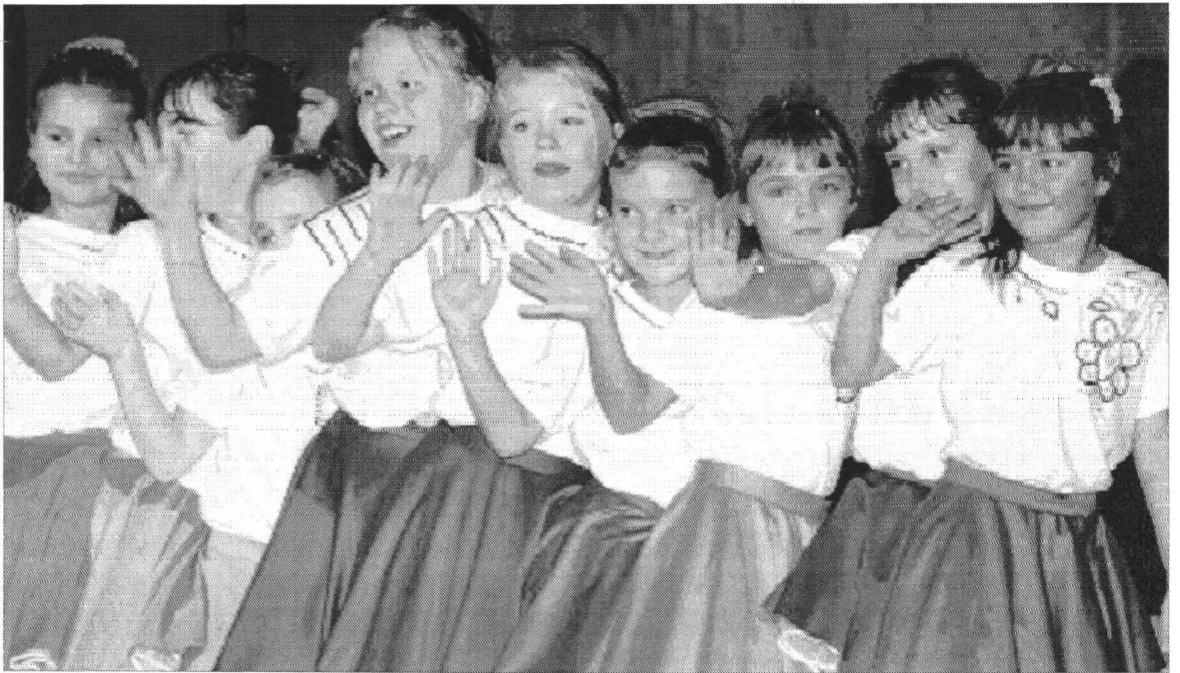
Die Rock'n'Roll Kinder und die Rocking Pussycats legen eine flotte Sohle auf das Parkett.