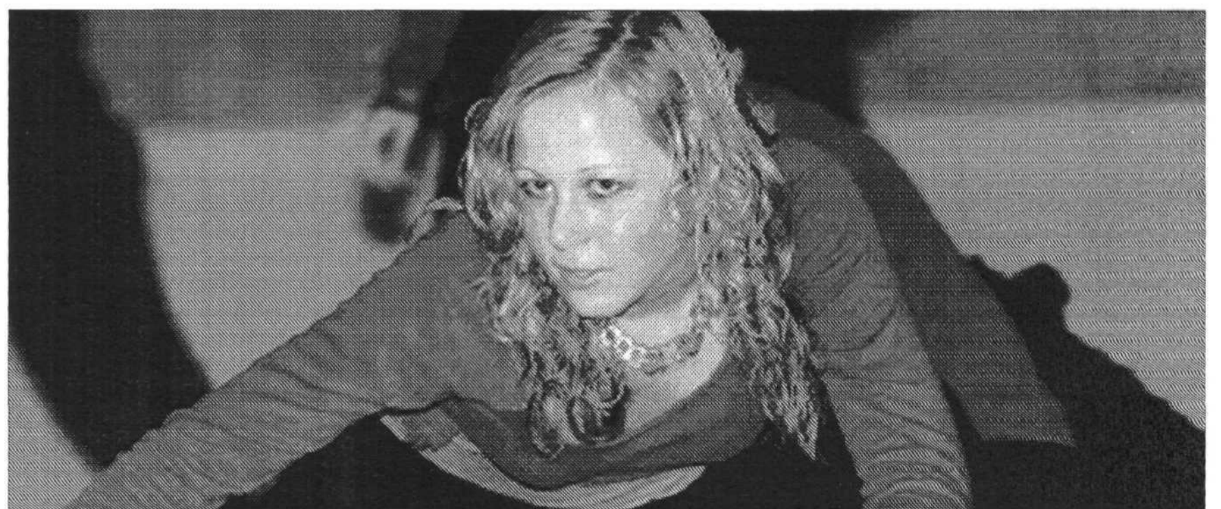
Im Urwald in Afrika zeigten die Jugendlichen eine African Footprint.

die drei Reisenden die Einheimischen. Dann stranden sie auf der Insel Hawaii. In Mittelamerika schließlich treffen die Dingolfinger temperamentvolle Menschen, bevor sie in den Hafen von New York gelangen. Dort heuern die drei auf einem großen Schiff an, das sie über'n Teich zurück nach Dingolfing bringen soll. So feiert man auf der Queen Mary II. die Heimfahrt bis zur Ankunft in Hamburg.