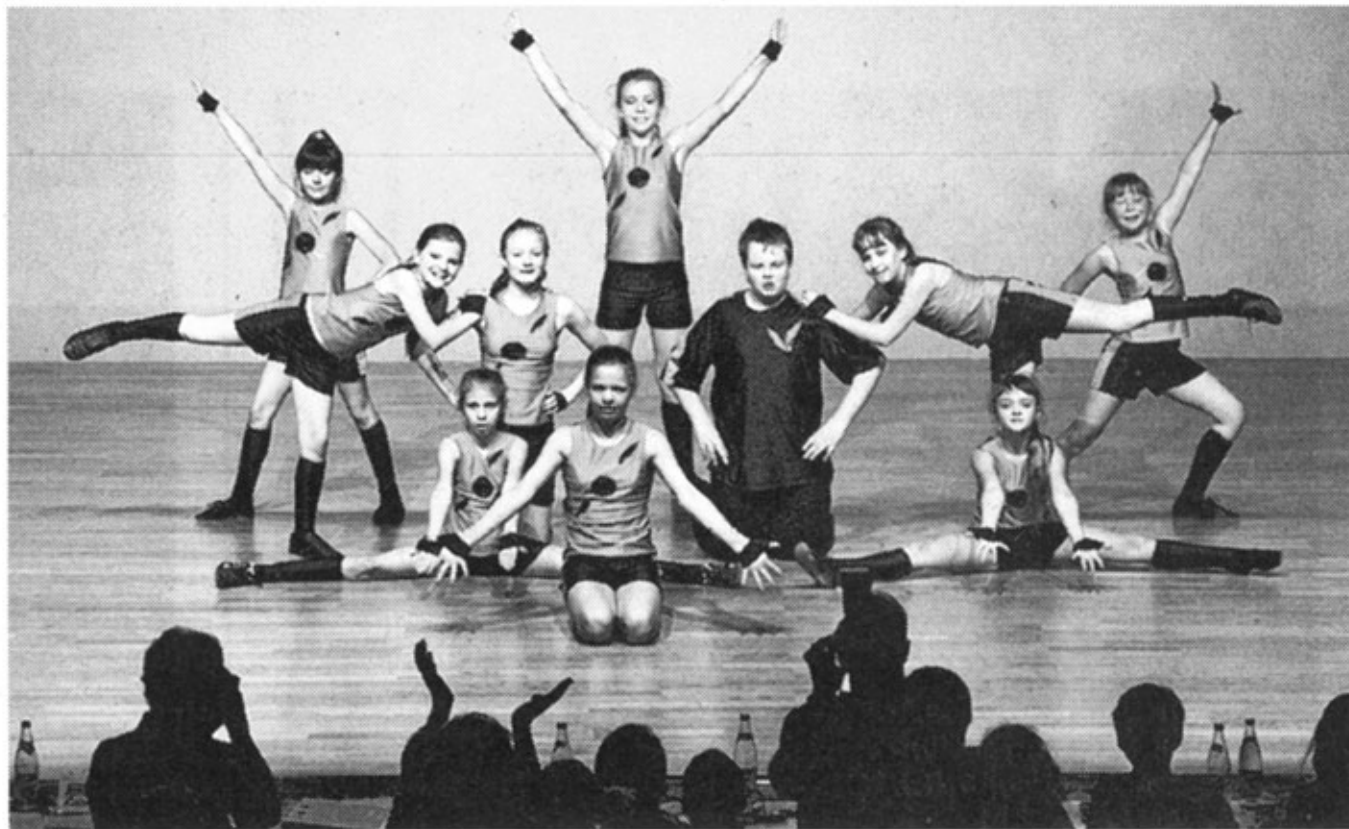
Die Formation „Rocking Pussycats“